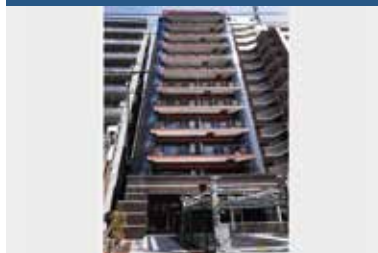
ヨーロッパン冷泉