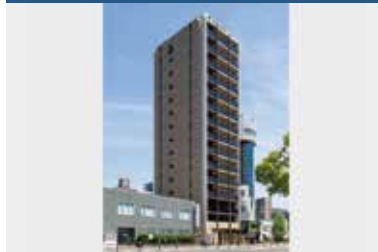
エンクレスト千早