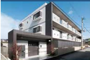
グランコート七隈