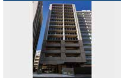
サンメゾン大濠公園北